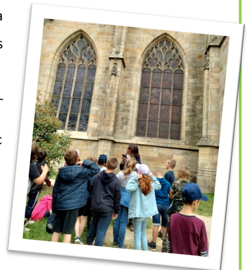
Sortie à Dinan

Cela permettra également de mettre en place des ateliers cuisines en collaboration avec les parents qui le peuvent, permettant ainsi de mettre en pratique les apprentissages réalisés en classe (mesure, conversion, proportionnalité). Ateliers riches et espérons le .... savoureux !!!