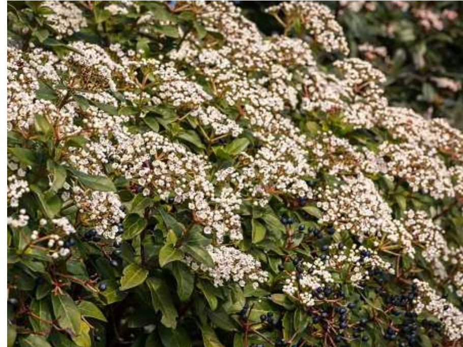
Laurier tin - Source : www.jardiner-malin